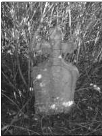
A sír 2006-ban

Az 1990-es évek elejétől az ipolyszakállosi iskolával közösen vettek részt helytörténeti táborokban a mikolai diákok. A helyi programokban a temetővel való ismerkedésnek is fontos szerep jutott. Jó 15 évvel ezelőtt Szatmáry István helytörténész, falukutató 1966-os krónikája ( Szatmáry István: Vámosmikola 1945 előtt. Vámosmikola – Szob, 1966. PmL. Ki. 16. ) alapján az egyik nyári táborban 1848-as honvédek sírját kerestük. Krónikaírónk a következőket említette