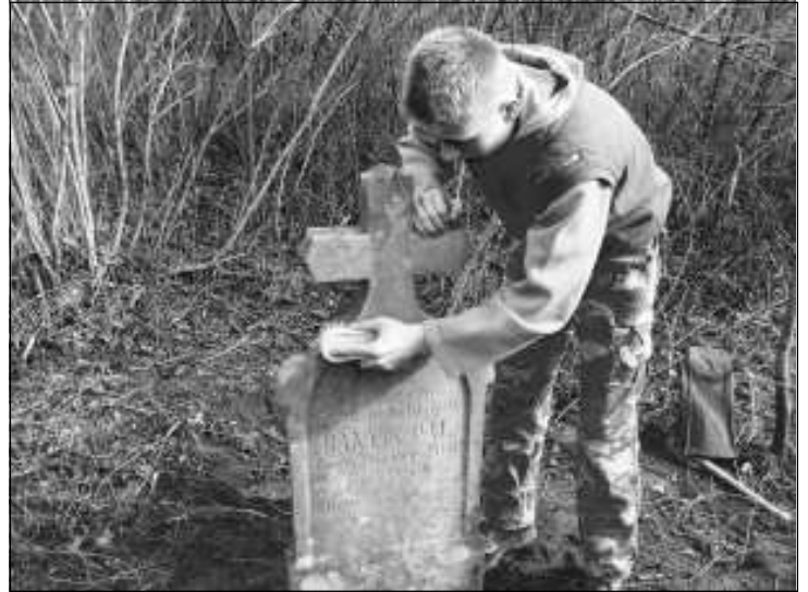
A síremléket tisztítása