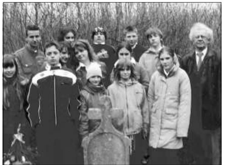
A megemlékezés résztvevői

szám) vajon testvérek voltak-e. A koszorú elhelyezése után megható pillanatok következtek: a legkisebbek, az ötödikesek – nem előre „megírt forgatókönyv szerint” – egy-egy szál élővirággal és gyertyagyújtással emlékeztek a 101 éve örök álmát alvó honvéd-