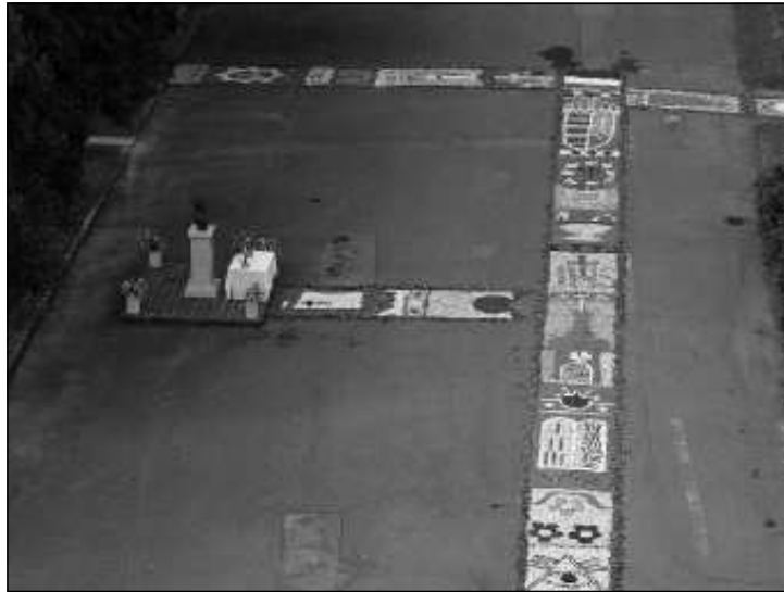
A virágszőnyeg.

A zöld ágakkal és virágokkal borított négy oltárnál az elmélkedés alaphangulatát az imádás, a hálaadás, az engesztelés és a kérés adja meg. Ezen a körmeneten kérjük a kegyelmet Istentől, hogy erősítse meg hitünket ebben a legszentebb titokban. Az előző évszázad közepéig az egyház tagjai mindig nagy részvétel mellett ünnepelték Úrnapját, és hitük félelem nélküli megvallásával vettek részt a körmeneten. Sajnálatos módon az európai ember meg-