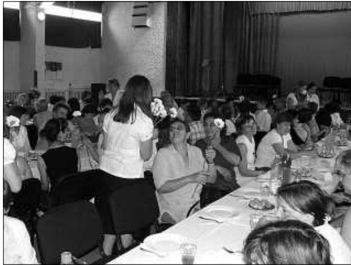
Együtt köszöntötték az integrált intézmény pedagógusait

Köszöntjük és tiszteljük azokat a pedagógusokat, akik egy élet