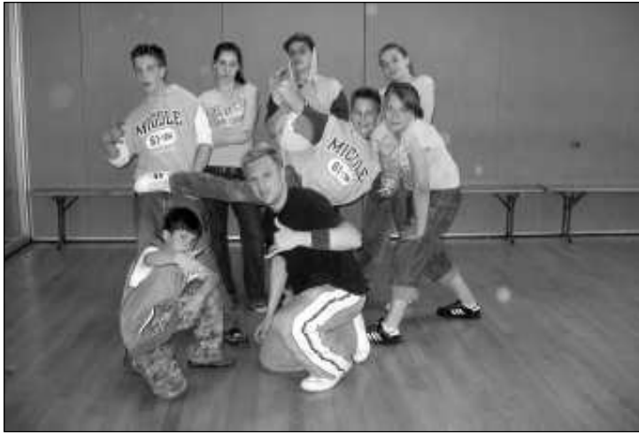
A bajnokságon résztvevők

Külön köszönet szeretnék mondani a támogatóinknak, akik segítsége nélkül nem utazhattunk volna el a versenyre. Köszönet tehát a Zollner Elektronik Kft-nek, az Iter-Granum Kht-nak, Kárpáti