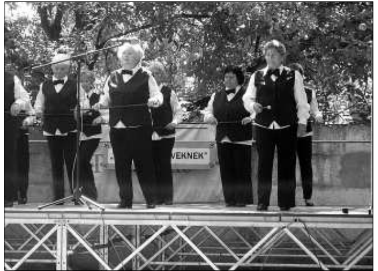
A Nyugdíjas Táncsoport

A Kék csapat sajnos a kevés próba következtében nem tudott kellően felkészülni, így rájuk nem tudtunk számítani. Csak a Piros csapat volt teljes létszámú. Így nyilvánvalóvá vált, hogy a kért időtartamú műsort nem tud-