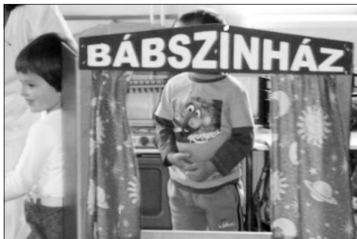
Ezek a játékos tevékenységformák elkísérik a gyermeket a nagycsoportig

A program célja: az önfelelt szabad játék biztosítása, ahol a gyermek kifejezheti önmagát; a beszéd-