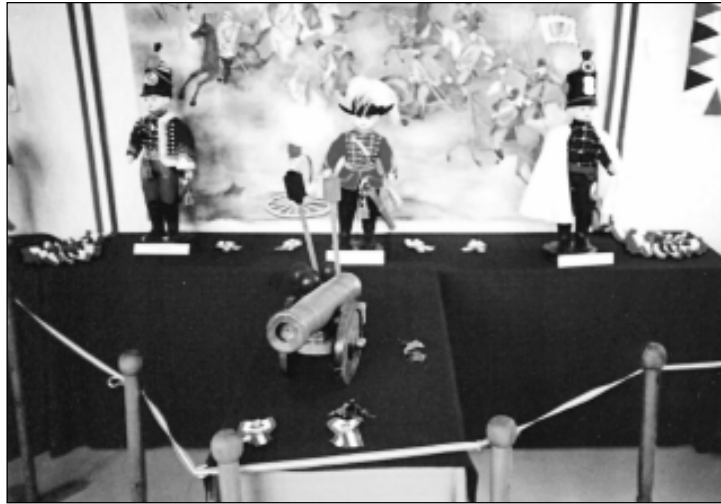
Egyenruhák a szabadságharc korából. A márianosztrai Virág Benedek Általános Iskola kiállítása, 1998

A nyár elejére kialakuló háborús helyzet új haderőszervezési módot sürgetett. A minisztertanács május 15-én 10 ezer főből álló „rendes nemzetőrség” felállítását határozta el. Az újonnan szervezett zászlóaljakat a szerb felkelés elleni harcok színhelyére és a fenyegetett Dráva mentére vezényelték. A kiküldött alakulatok azonban jelle-