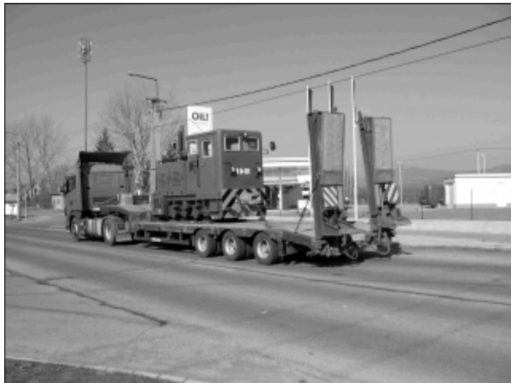
A mozdony itt még nem a saját "kereken" érkezett Szobra

típusú, az egykori NDK-ban gyártották. Magyarországra kevés jármű került, abból mára már csak egy üzemel Szilvásváradon. A szobi jármű Kecskeméten volt kiállítva, eléggé