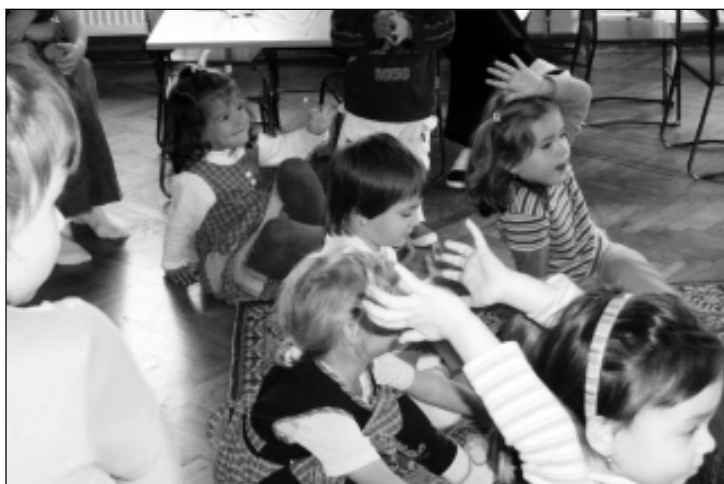
Minden gyerek egyedi, egyszeri és megismételhetetlen

KER. Mi ebben az újdonság? A szülők és nagyszülők számára semmi, mert ők felidézve gyermekkoruk emlékeit megtapasztalták már, hogy a közös éneklés, játék, színjátszás, az együttes tevékenység maga volt a siker. Ez a siker adta az indítást, hogy megtaláljuk azt a legjobb módszert, azt a tevékenységformát, amelyben a gyermek kibontakozhat, rejtett képességei a felszínre kerülhetnek. Minden gyerek egyedi, egyszeri és megismételhetetlen. Minden gyermekben van valami érték, amit