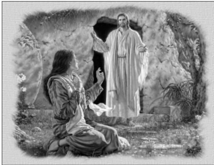
A Húsvét lényege a lelki felkészülés a kereszténység legfontosabb ünnepére, Jézus feltámadására.

A nagyhét előtti, úgynevezett virágvasárnap Szent Máté szerinti Passiót éneklí a temp-