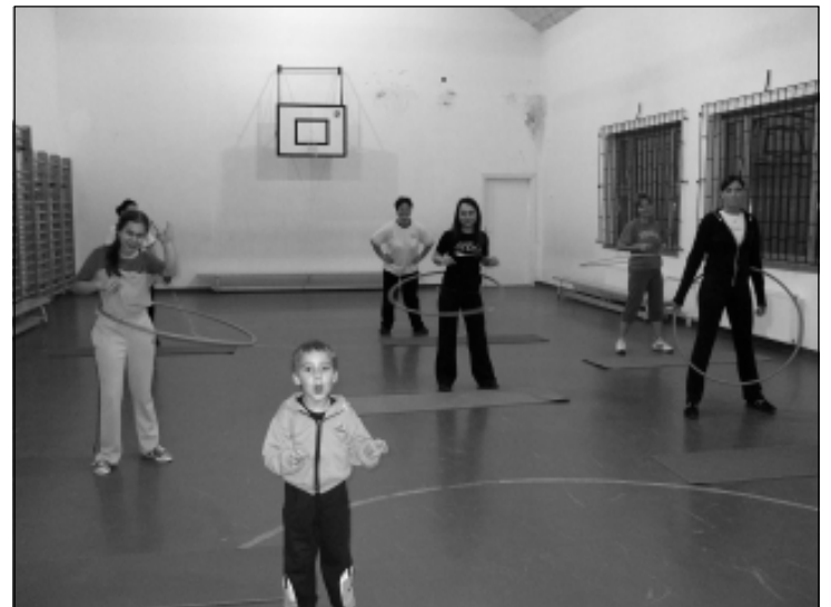
A kicsik is mindig élvezik, ha mozoghatnak

gyást, a méreganyagok ürülését, sőt bőrünk is szebbé válik hatására. Különösen hasznos az infrasauna, többek között azért, mert kevésbé terheli meg a szervezetet, így a szív és érrendszeri betegségben szenvedők is igénybe vehetik, valamint hatékonyabban méregtelenít.