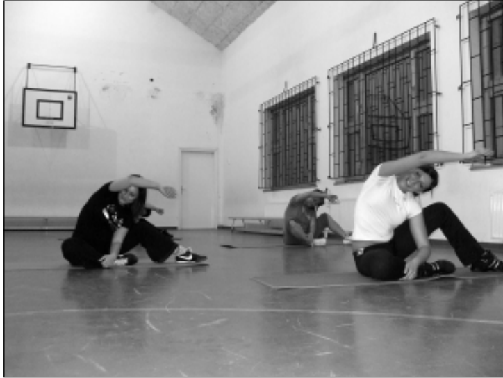
Mozgás hiányában elsősorban az izmok fogynak el és nem a zsírpárnák

- AEROBIK edzéslehetőségek: KEDDEN és CSÜTÖRTÖKÖN 18.00-19.00-ig a Fekete István Általános Iskola