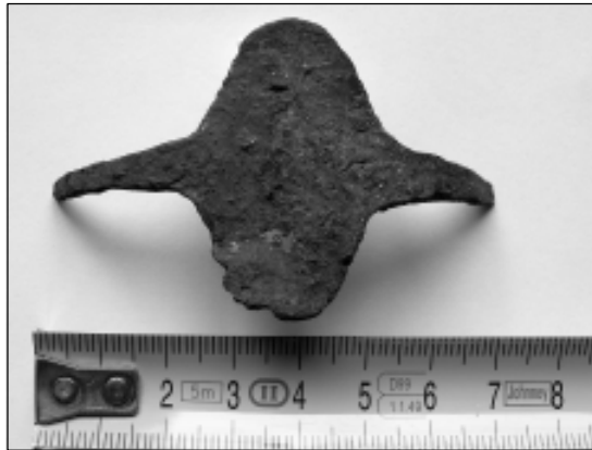
Középkori dunai hajókon használt iszkába-szeg