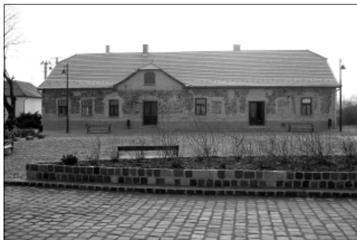
Kirajzolódnak a korábbi átalakítások nyomai

tása sok pénzbe kerül, és ez függ az új tulajdonos anyagi helyzetétől is. Csak abban lehetett reménykedni, hogy a tulajdonos - lévén szobi lakos -, előbb-utóbb elkezd. Nos ez tavaly nyáron megtörtént.