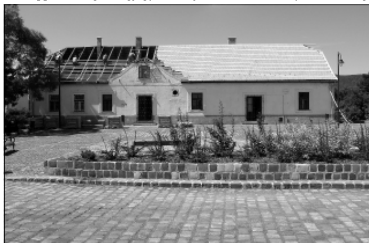
Új cserepeket kapott az épület

ket. A tény igaz volt, de abba már kevesen gondoltak bele, hogy Szob egyik legrégebbi épületének felújí-