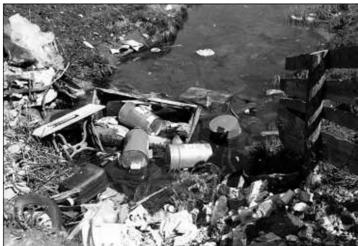
Szükségszerűen szemléletváltásra lesz tehát szükség a településtisztaság területén, ha nem akarjuk, hogy városunkat elborítsa a szemét

a térségben szelektíven gyűjtött hulladékokat, amelyeket szétválogatnak, lebáláznak, majd onnan a hasznosító üzemekbe szállítanak. A kezelőközpont egyéb sajátossága, hogy a háztartási hulladék kezelését nem hagyományos lerakással oldják meg, hanem Európai Unió mintára mechanikai-biológia előkezelést alkalmaznak. Az eljárás során a