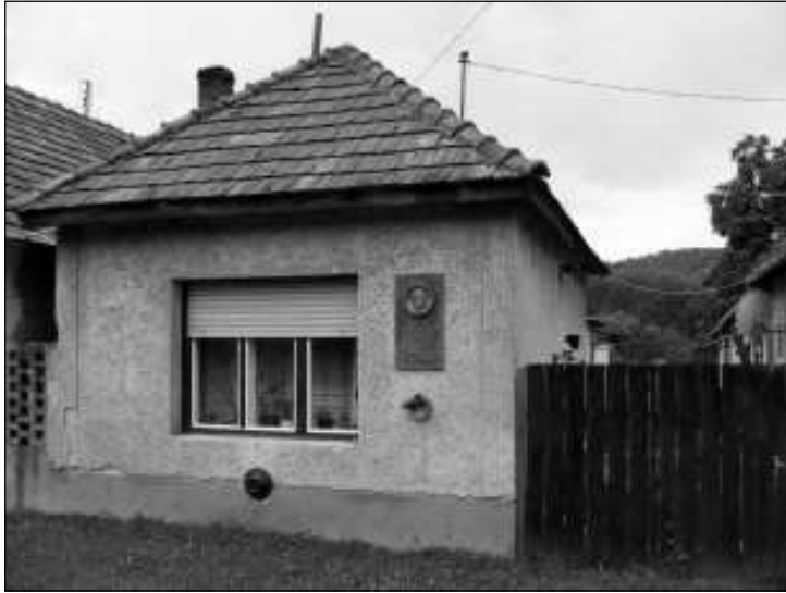
Ipolydamásdi ház Görgey Artúr emléktáblájával

római katolikus temetőben; A megbékélés kapuja emlékezteti az ipolysági temetőben szemlélődő látogatókat (1990-es évek) Cikksorozatunkat azzal a történelmi emlékhelyek felkeresése; a kiemelkedő történelmi események tanítása és tanulása; a helytörténeti emlékek összegyűjtése; sírok, emlékmű-