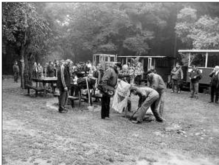
A centenárium tiszteletére tölgyfát ültetnek a résztvevők

Az eső, a köd ellenére sokan eljöttek ünnepelni velünk, s noha az időjárás az eredeti terveket átírta, nem maradt el rendezvény. Délben a nagybörzsönyi állomási büfében forró helyben készült gulyással várták az üzemeltetők a vendégeket, de délután, Ayala parodista művész előadása alatt a vasúti személyzet által készített finomságot is meg lehetett kóstolni. Az Uborka című politikai saláta népszerű humoristája az egykori MTV-műsorból lett ismerté. Nagybörzsönyben megelenedett Columbo hadnagy