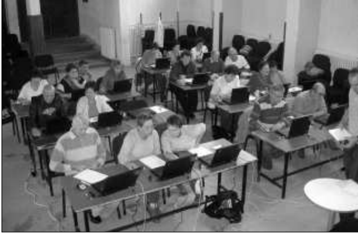
Ismét az "iskolapadban"

kal egyetemben. Az első napon felmerülő kisebb technikai hibát is gyorsan sikerült orvosolni, hála az egyik hallgató szakmai hozzáértésének. Egy szó, mint száz: nagyon jó közösség jött itt össze, akik három napon keresztül belekóstolhattak a számítógép