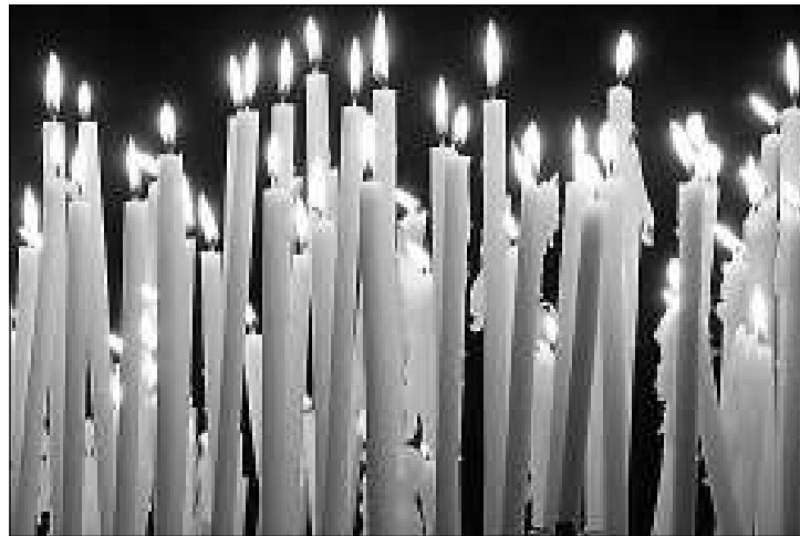
Mindazokért egy-egy gyertya égjen

Hivatásom teljesítése közben nem ritkán találkozom olyanokkal, akiknek szívében semmi sem képes szétoszlatni a halál elbizonytalanító, félelmetes ho-