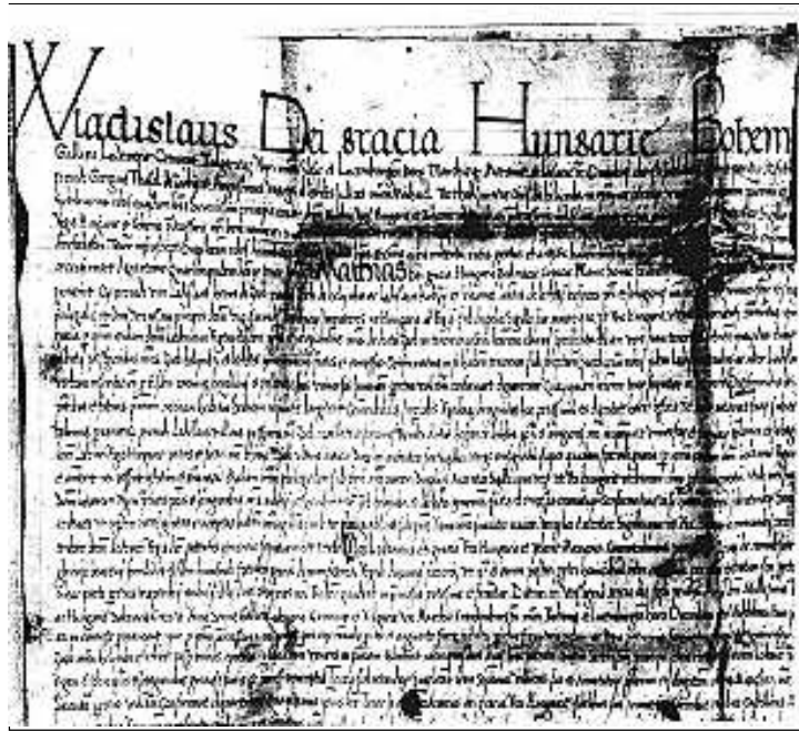
II. Ulászló oklevelének részlete Szob-Helemba-Letkés hajósnépekéről.

még a Duna-medencében, pedig az őskortól a római koron át az újkorig ez volt a kereskedelmi és hadi utak egyetlen "sztrádája" a Kárpát-medencében. Ez a kiállítás annak a kutatásnak és tervezésnek a kez-