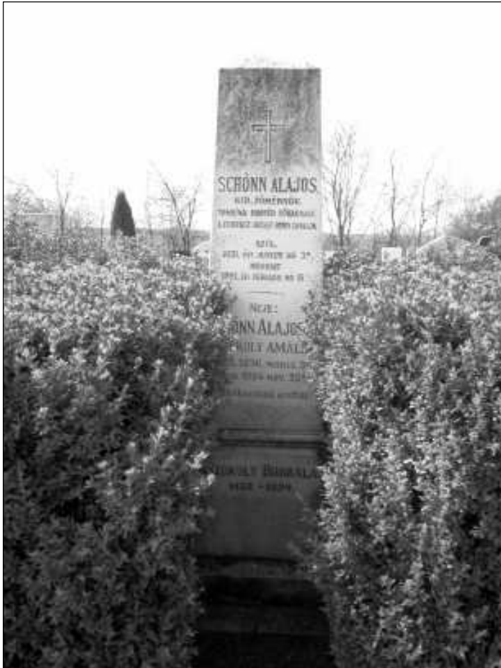
Schönn Alajos főhadnagy sírja, Bernecebaráti

Felhasznált irodalom: Szenássy Árpád: Az 1848/49-es szabadságharc emlékhelyei.