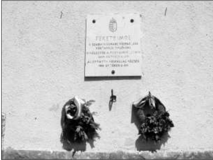
Fekete Imre emléktáblája Kóspallagon

IPOLYSZAKÁLLOS/IPEL/SKÝ SOKOLEC : Mészáros Alajos sírja.