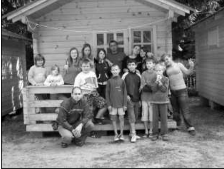
Az augusztusi tábor résztvevői

zésünkre bocsátotta a tulajdonában lévő nyári tábort, illetve annak faházait. Százezer forint összegű, pénzbeli támogatással segítette munkánkat a Pest Megyei Esélyek Háza közelmúltban megnyílt váci irodája. A Magyar Vöröskereszt Pest Megyei Szervezete 170 kilógramm édességgel és 240