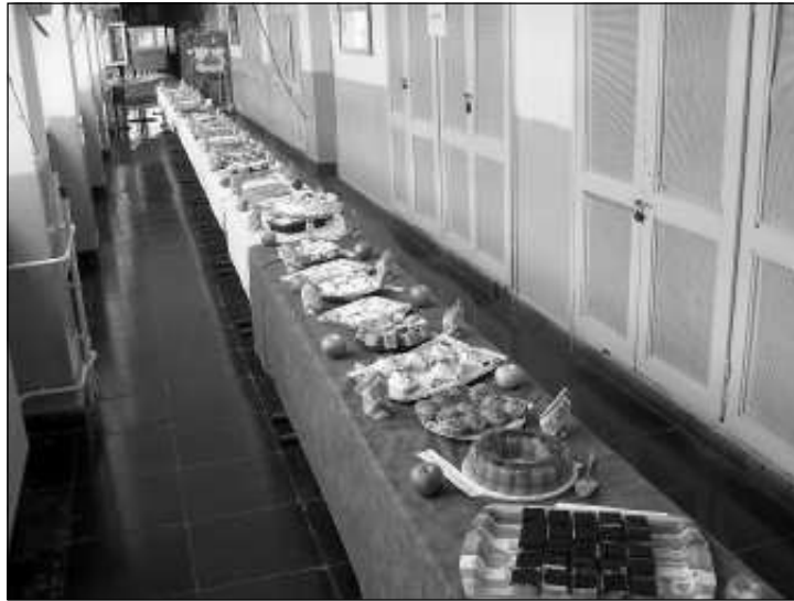
A nap "gasztronómiai koronáját" minden bizonnyal az almásütemények kóstolója, versenye jelentette

A legjelentősebb vállalkozások mind képviseltették magukat gyümölcsökkel a fesztivál