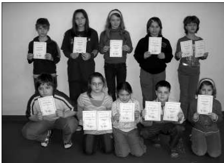
A legjobbak között lenni nem is olyan könnyű. Sikerek és oklevelek