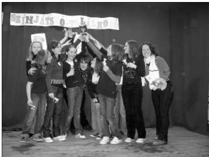
Színpadon a Gézengúzok az elismerést jelentő kupával

elmondta - hogy az előadás hatására többször végig futott rajta a hideg. Gratulált a csoportnak, a témaválasztáshoz, a rendezéshez és színesi játékhoz. Kísérőként nagyon büszke voltam diákjainkra, hisz még én is sok gratulációt kaptam, amit saját dicsérettel együtt átadtam a csoport vezetőjének és a csapatnak. Nagyon jól éreztem magam ezen a délutánon, örömmel töltött el a sok