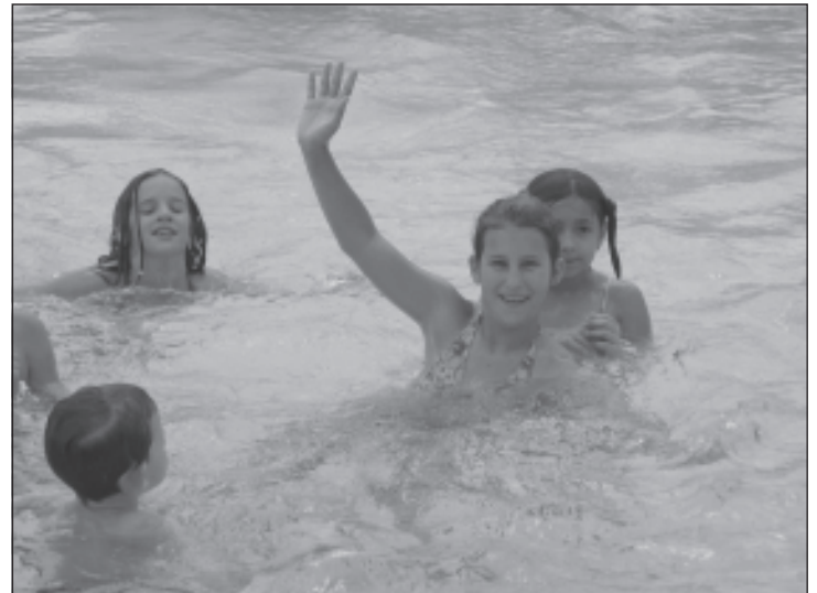
Füzdözés a gödi strandon

si házban tartottuk meg. Utolsó napon, szombaton előadtuk a betanult táncokat, az egész héten rendezett sportversenyek eredményhirdetéskor megkaptuk a jól kiérdemelt édessége-