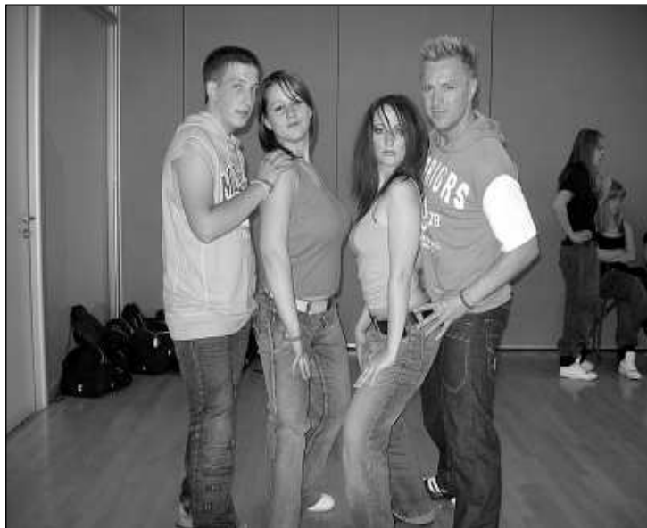
A versenyen résztvevő csapat tagjai