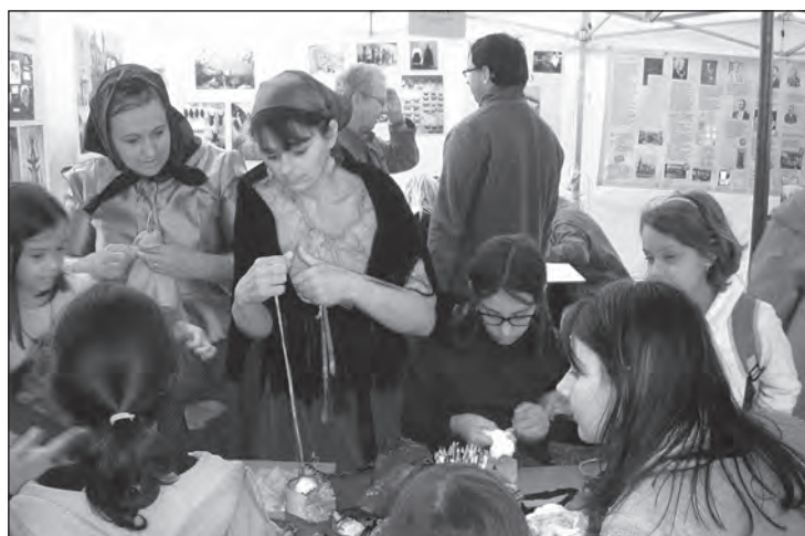
Standunk előtt mindig nagy volt a forgatag