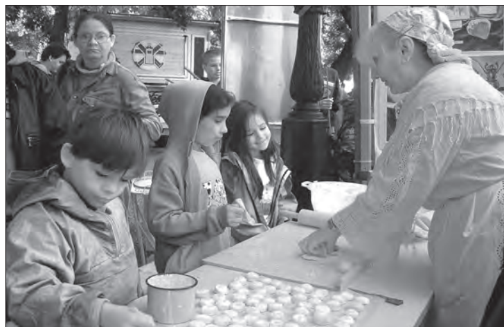
Pogácsaszaggatás. A recepteket lapunk 9. oldalán közöljük