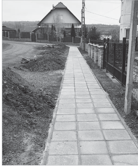
Közfoglalkoztatottak építettek járdát a Meggyfa utcában

szünetben étkezést, és sikerrel pályázott tűzifa-vásárlás támogatására is. A beérkezett tűzifa igényléseket éppen a napokban bírálja el a szociális bizottság.