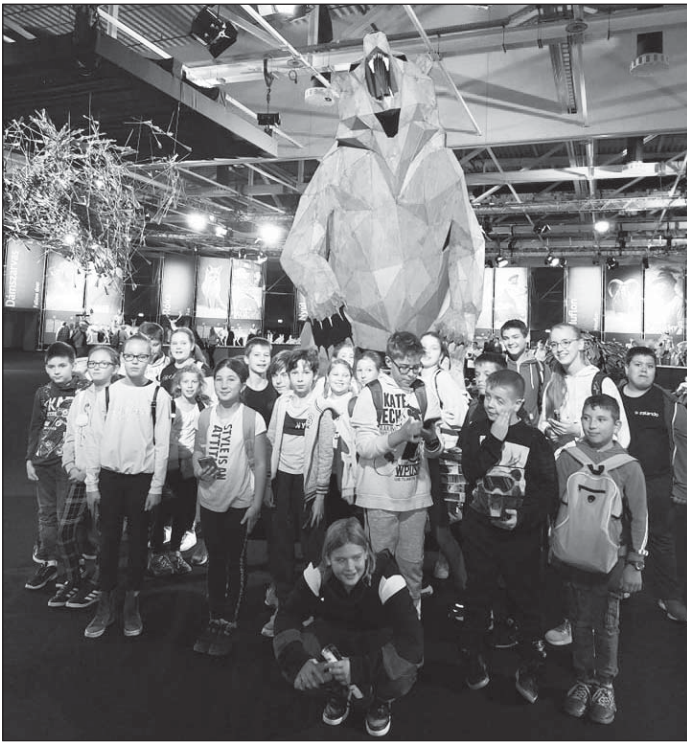
Vadászati kiállítás 5. osztály