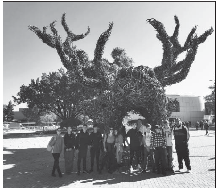
Vadászati kiállítás 8. osztály