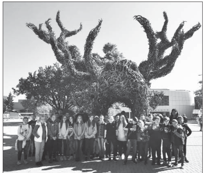
Vadászati kiállítás 6. osztály