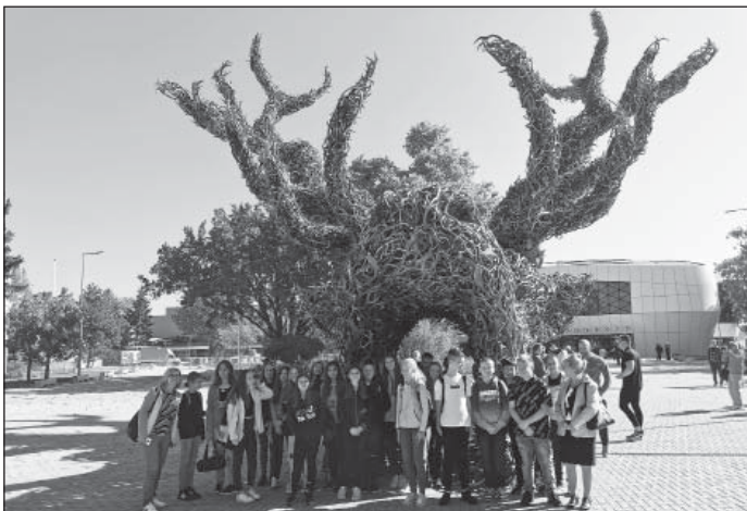
Vadászati kiállítás 7. osztály