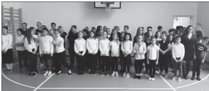
A Zene Világnapja

Első alkalommal került megrendezésre hagyo-