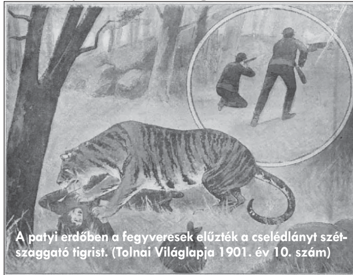
A patyi erdőben a fegyveresek elűzték a cselédlányt szétzaggató tigrist. (Tolnai Világlapja 1901. év 10. szám)