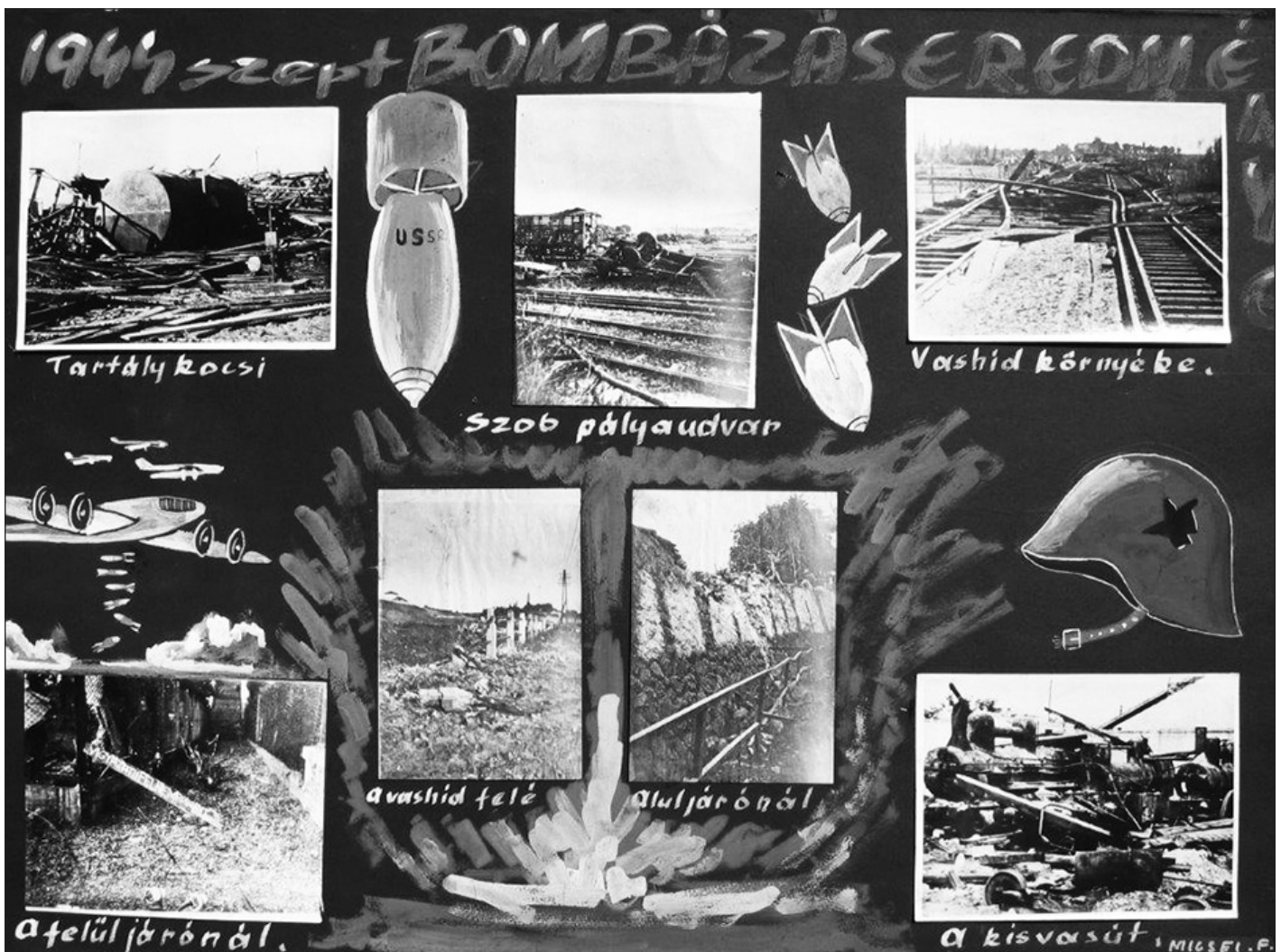
Az 1944-es szobi bombázás képmontázsa

1944. december 5-től a német és a szovjet hadi jelentések alapján szinte napi tudósítások olvashatók a kö-